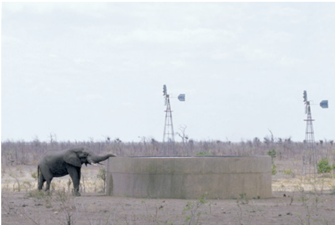
Un elefante solitario busca una fuente inusual de agua potable en el Parque Nacional Kruger durante la sequía de 1992, cuando el Río Sabie dejó de discurrir por primera vez que se recuerde.

Por ejemplo, las riberas de ríos que se han desestabilizado debido a la eliminación de vegetación ribereña pueden sufrir grave erosión con el establecimiento de caudales variables. De igual modo, la inundación de humedales y llanuras inundables gravemente degradados y contaminados puede causar o agravar plagas de malezas y hacer que los contaminantes se extiendan por toda la cuenca. No se prefiere, pues, la opción de establecer caudales ambientales en total aislamiento.