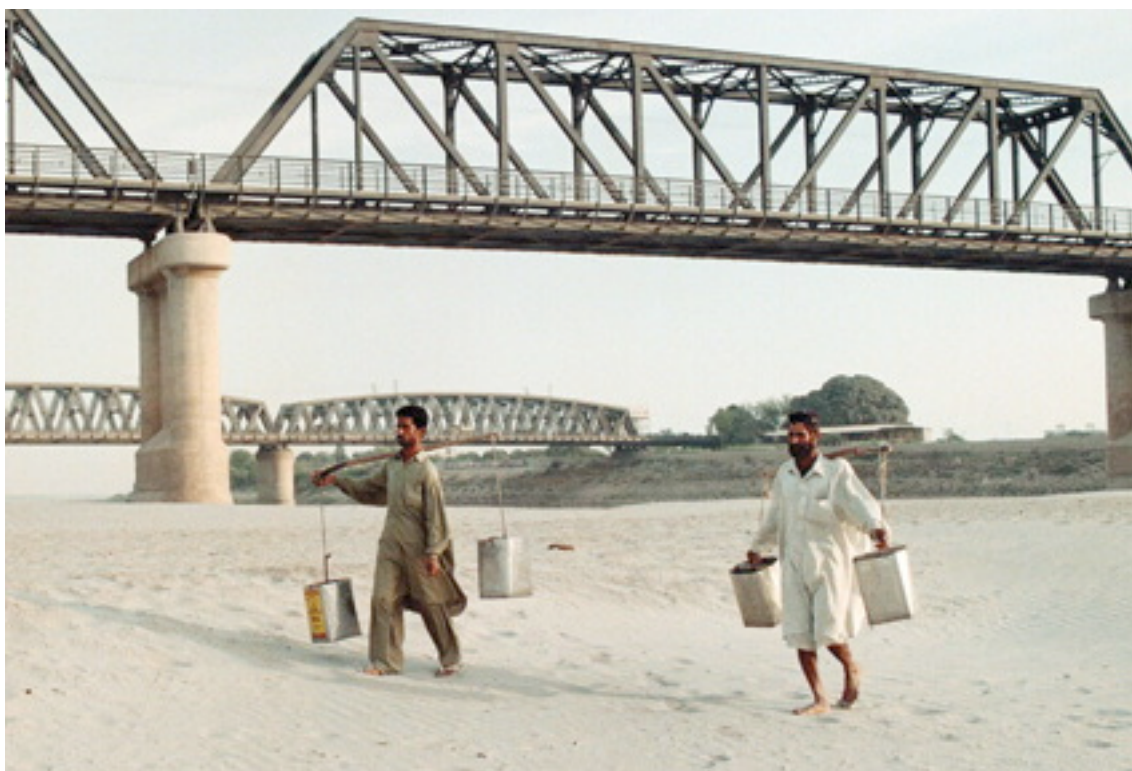
Residentes acarrean latas vacías mientras recorren el lecho seco de un río en busca de agua cerca de Hyderabad, a unos 160 km. de Karachi.

Los ríos y otros sistemas acuáticos necesitan agua y otros insumos, como detritos y sedimentos, para permanecer sanos y proporcionar beneficios a las personas. Los caudales ambientales contribuyen en forma sustancial a la salud de estos ecosistemas. Quitarle a un río o a un sistema de agua subterránea estos caudales no sólo daña todo el ecosistema acuático, sino que también amenaza a las personas y comunidades que dependen del mismo. En el caso más extremo, la ausencia a largo plazo de caudales pone en riesgo la existencia misma de ecosistemas dependientes y, por tanto, las vidas, los medios de subsistencia y la seguridad de comunidades e industrias río abajo. El punto, pues, no es si podemos permitirnos el lujo de establecer caudales ambientales sino si una sociedad cualquiera puede permitirse el lujo de no establecerlos y por cuánto tiempo.