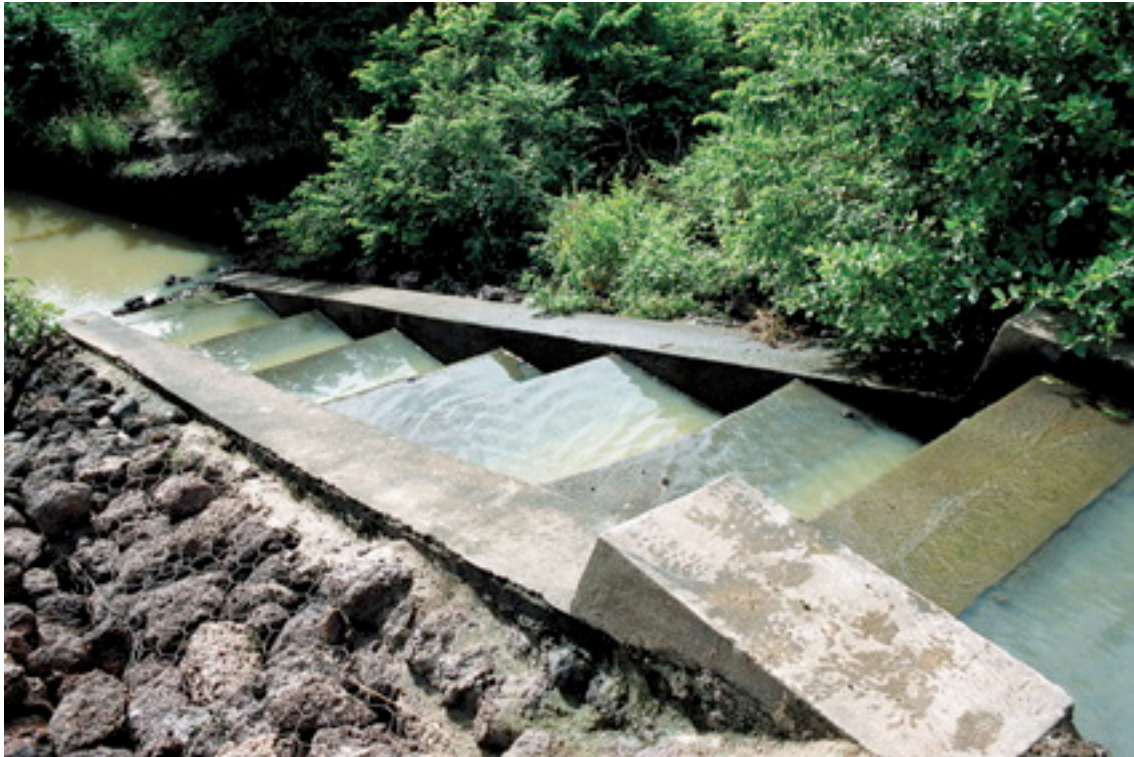
El gradiente para peces les permite migrar más allá de la represa de irrigación (Burkina Faso). Las gradientes para peces son una mejora importante en infraestructura que puede darse junto con las descargas de caudal ambiental.