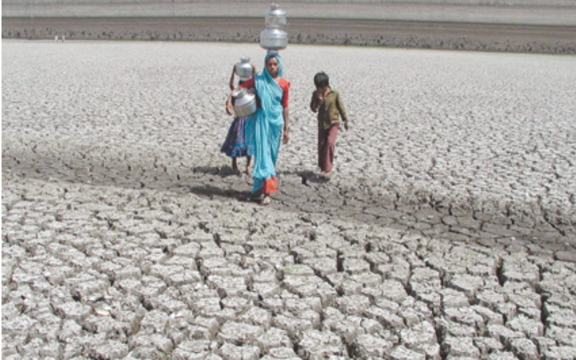
Una mujer india cruza a pie el lecho seco de un lago acarreando en la cabeza jarras para recoger agua en el distrito Rajkot de Gujarat