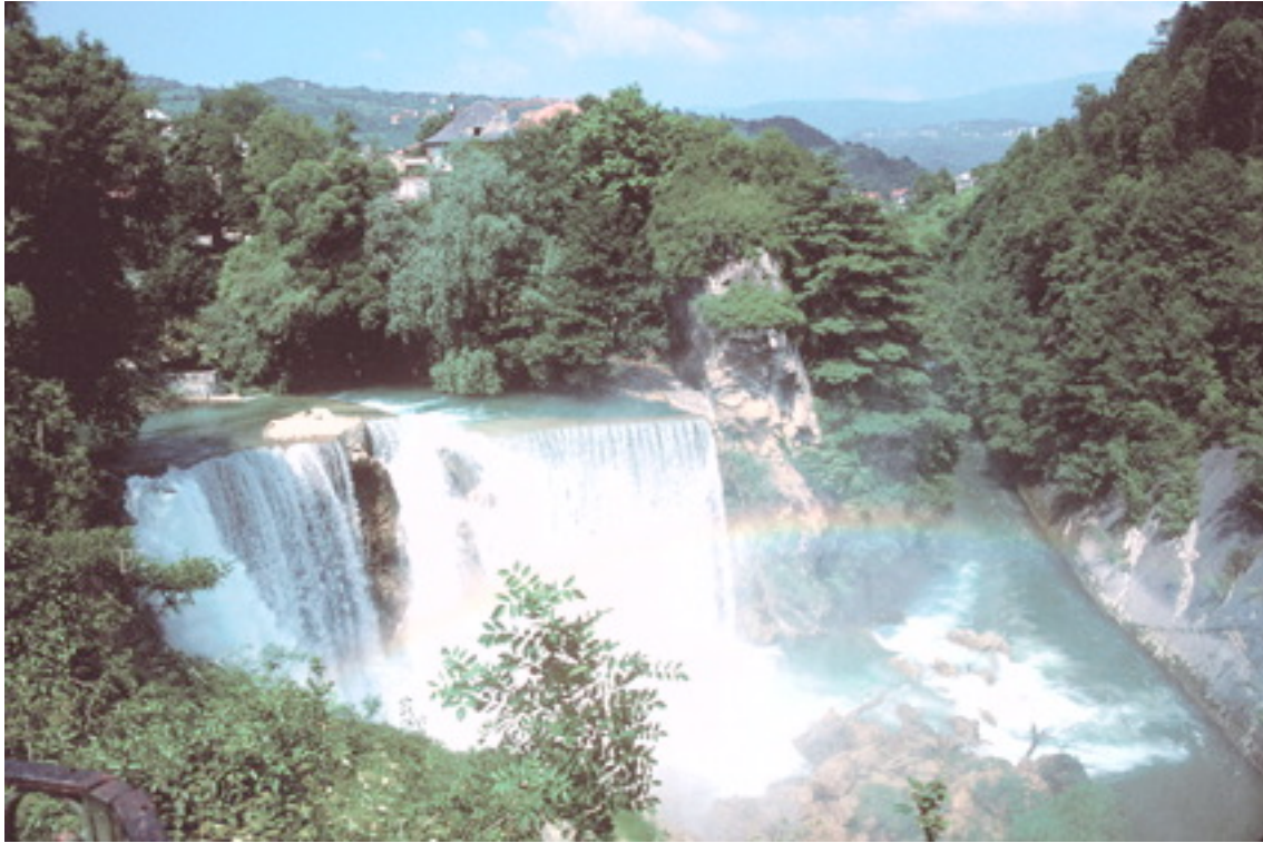
Catarata en Bosnia-Herzegovina

A partir de ello, la Comisión Mundial de Presas 57 identificó la necesidad de una evaluación completa de opciones al comienzo mismo del ciclo del proyecto con el fin de asegurar que se pudieran incorporar a la toma de decisiones factores ambientales y sociales.