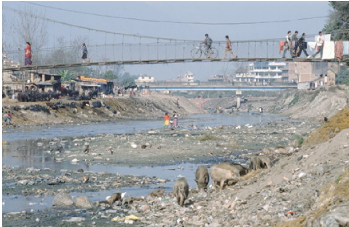
La ausencia de una descarga mínima conduce a una grave contaminación del Río Vishnumati en Katmandú (Nepal)

La aplicación de ese enfoque dentro de un sistema en el que los derechos están en manos privadas puede facilitar la transferencia de agua para fines dentro de la corriente fluvial de acuerdo con los valores económicos relativos del agua en el curso fluvial o fuera del mismo. Sin embargo, no es probable que un mercado “libre” de agua sea suficiente para alcanzar objetivos de caudales ambientales, dado el amplio conjunto de incentivos sociales y económicos que es probable que inclinen la balanza a favor de utilidades fuera de la corriente fluvial. En vez de ello, 77 es importante ofrecer un marco regulador que pueda dirigir la reasignación de agua entre utilidades en la corriente fluvial y fuera de ella en la dirección que la sociedad desea.