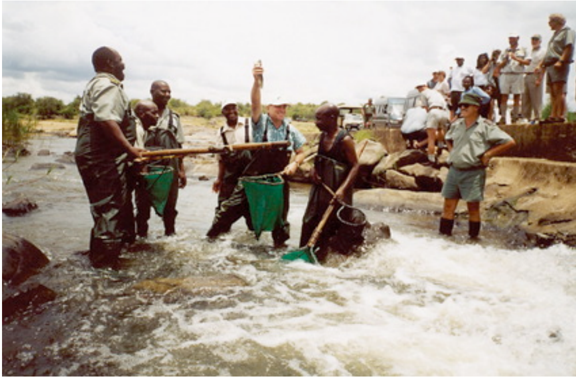
El Ministro de Recursos Hídricos de Sudáfrica, Ronnie Kasrils, muestra los resultados del Programa de Salud Fluvial