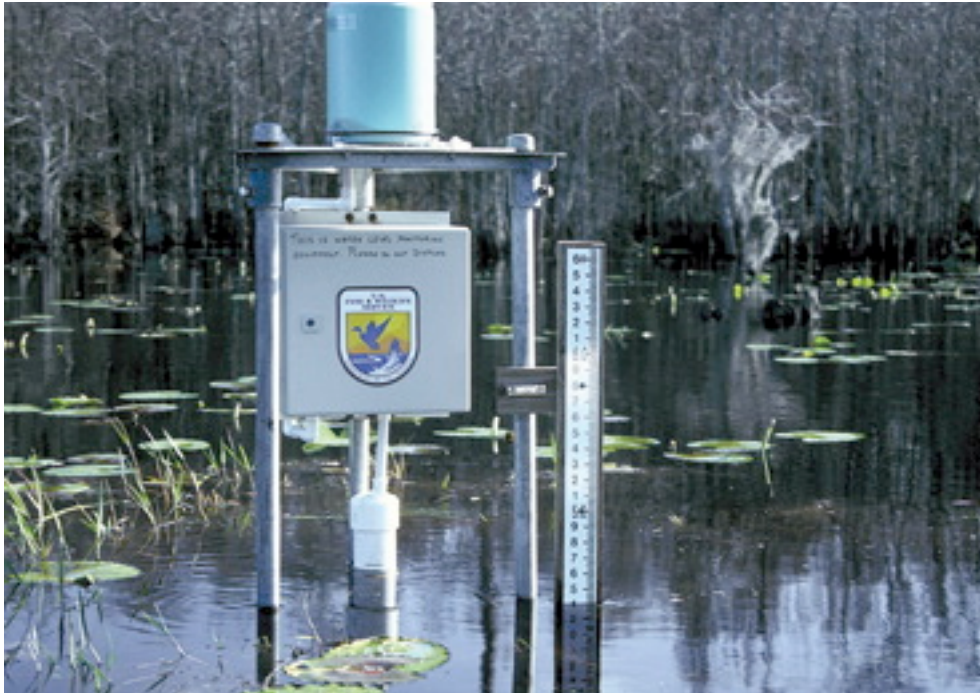
Monitorear el nivel del agua es un elemento esencial de la gestión del caudal ambiental.