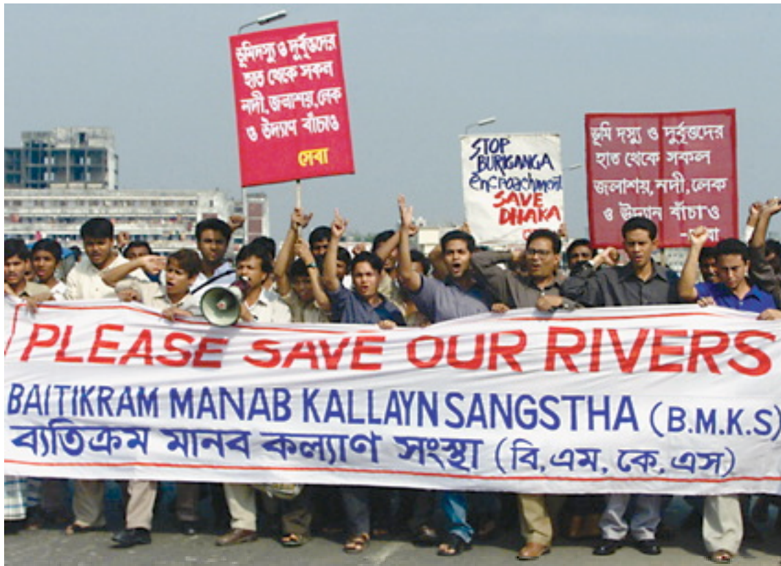
Marcha de grupos de protesta en Bangladesh para presionar a las autoridades para que detengan la intrusión en el Río Buriganga, que obstruyó el caudal fluvial (Noviembre del 2002.)

El objetivo sería encontrar a personas con credibilidad que puedan promover el tema desde la mayor cantidad posible de alternativas. Esto incluirá a personas que pueden introducir el tema desde una perspectiva científica, hasta usuarios que pueden hacerlo en el contexto de impactos locales. Será sumamente valioso contar con algún político vigoroso e influyente y convencido del tema.