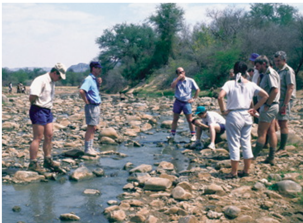
Expertos analizan las consecuencias ecológicas de la sequía de 1992/1993 para el Río Olifants

Leer informes de evaluaciones de caudal ambiental en cuencas fluviales alrededor del mundo proporciona información valiosa acerca de los aspectos prácticos del proceso de caudales ambientales, de los métodos utilizados y de sus necesidades de datos. Visitar de hecho cuencas fluviales, sin embargo, y analizar aspectos relevantes con científicos, gestores de agua y partes interesadas, proporciona ideas y comprensión que no se puede lograr por medio de la palabra escrita.