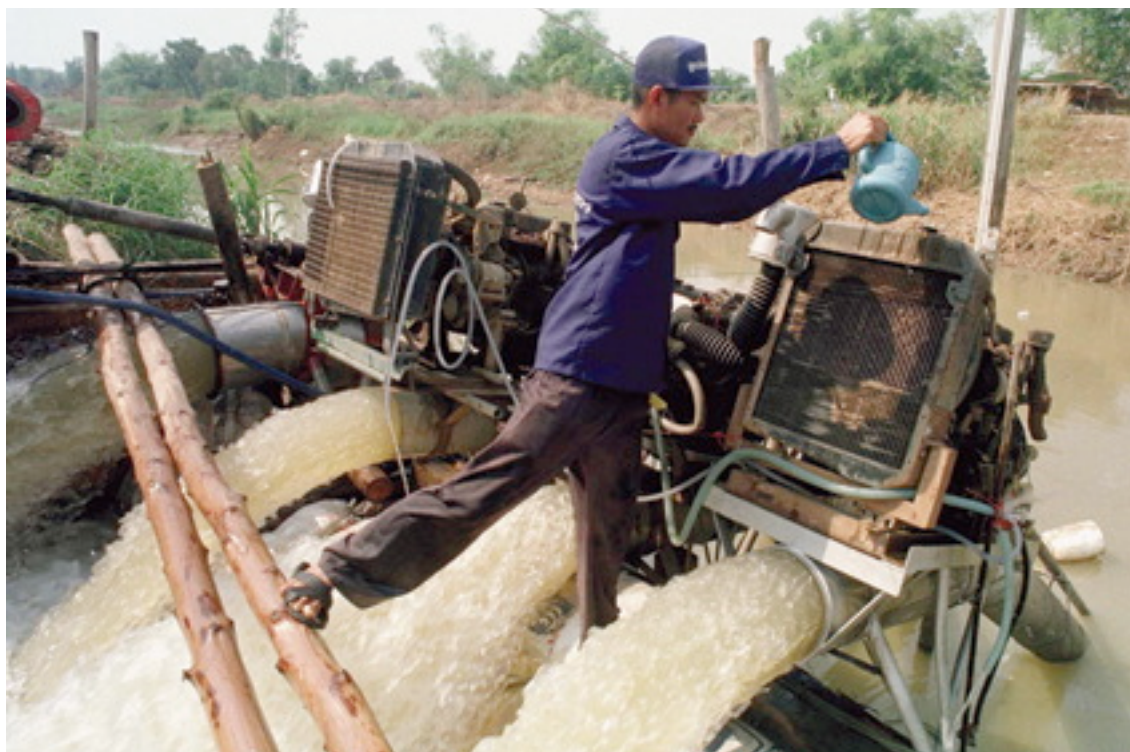
Un agricultor thai bombea agua en Pathum Thani, Tailandia. Durante 1999, cultivadores de arroz y naranjas bombearon grandes cantidades de agua de ríos durante la peor estación seca en décadas debido al Niño.

Entre las técnicas legislativas que se han utilizado están: un requisito legal de que se provea un caudal “ambiental” mínimo; legislación para la adopción de ríos en estado natural y panorámicos; la aplicación de la doctrina de fideicomiso público; y la gestión regulada de caudales para proveer beneficios ambientales. En particular, cuando se trata de ríos con exceso de asignación de agua, se han incluido en algunos casos estipulaciones para la adquisición obligatoria y voluntaria de derechos existentes de agua. Más abajo se ofrecen ejemplos de estas técnicas.